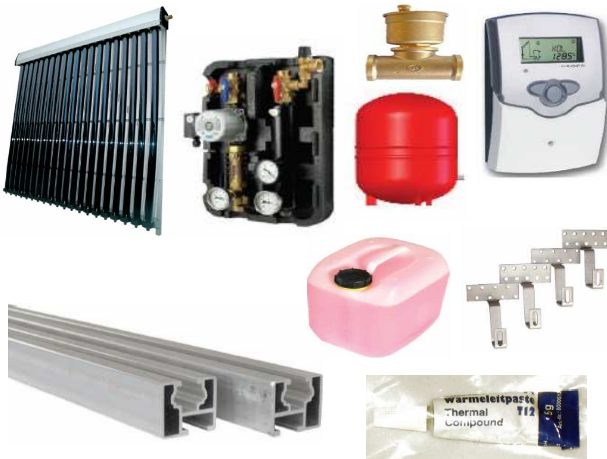
Typ V20: kolektorové pole o 20ti trubcích